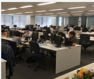
本社人事中心の フロア勤務状況(9時30分)