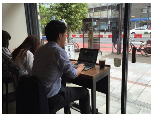
カフェでテレワーク