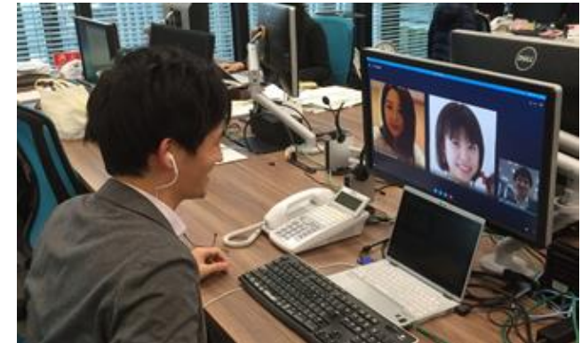
写真3：テレワーク中社員とのTV会議