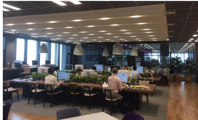
写真2：社内サテライトオフィスでの業務風景