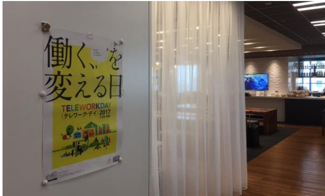
写真1：ポスター掲示@社内Cafe