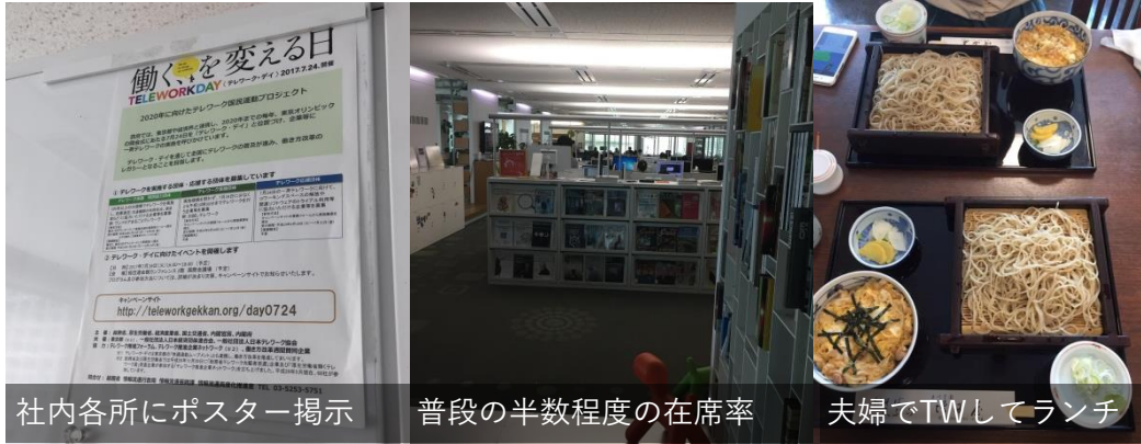
社内各所にポスター掲示 普段の半数程度の在席率 夫婦でTWしてランチ